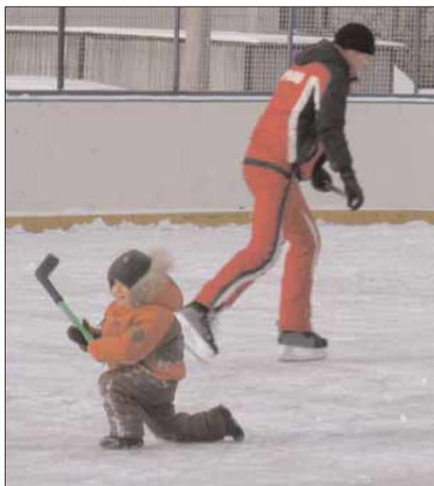
Порадовали ребят игры с клоунами и аниматорами, подарки и призы от Деда Мороза и Снегурочки

В течение месяца в учреждении проходила выставка детских рисунков «Зимняя сказка». За это