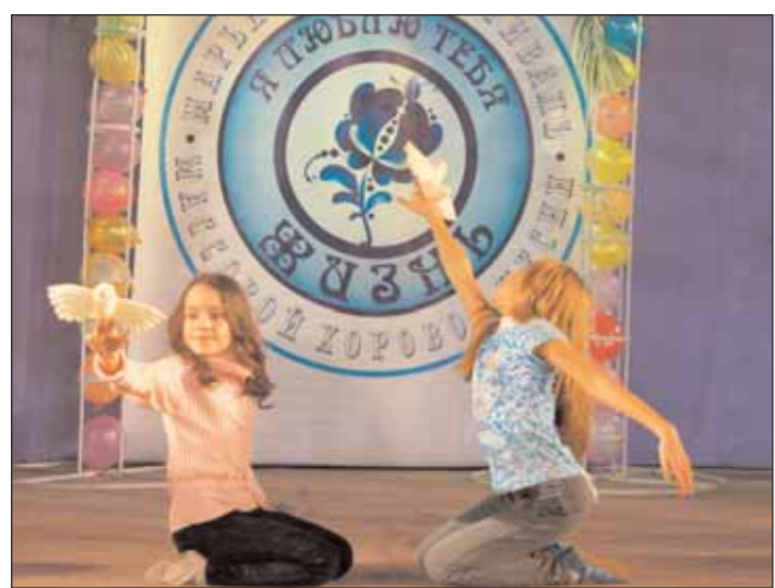
В ЦСО «Фантази-парк» прошёл песенный фестиваль «Я люблю тебя жизнь!»