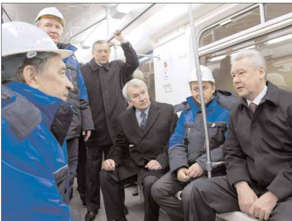
Мэр Москвы в вагоне пообщался с метростроителями

Сегодня планируются сроки ввода станций на ближайшие годы выглядят так.