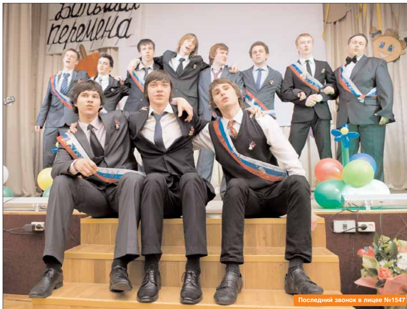
Последний звонок в лицее №1547